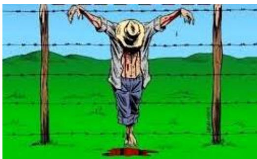
Figura 2; Número de militantes mortos em conflitos ambientais, em dez anos, supera o de militantes políticos mortos no período do regime militar, em vinte anos. Acesso em < www.ambientelegal.com.br/o-brasil-no-topo-dos-crimes-por-conflitos-ambientais >, setembro de 2016.